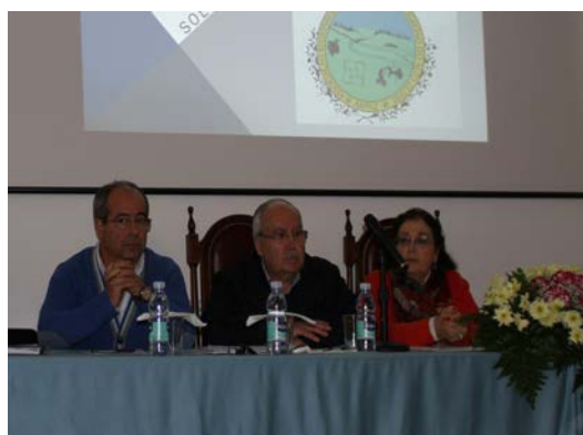
Mesa Assembleia Geral (Dez 2012)