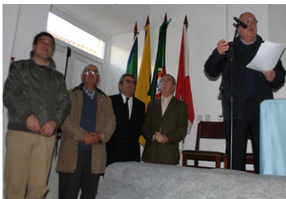
Presidente da Assembleia Geral com actual e anteriores presidentes da Direção