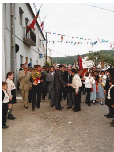
Visita Secretário Estado Rui Cunha, 1997