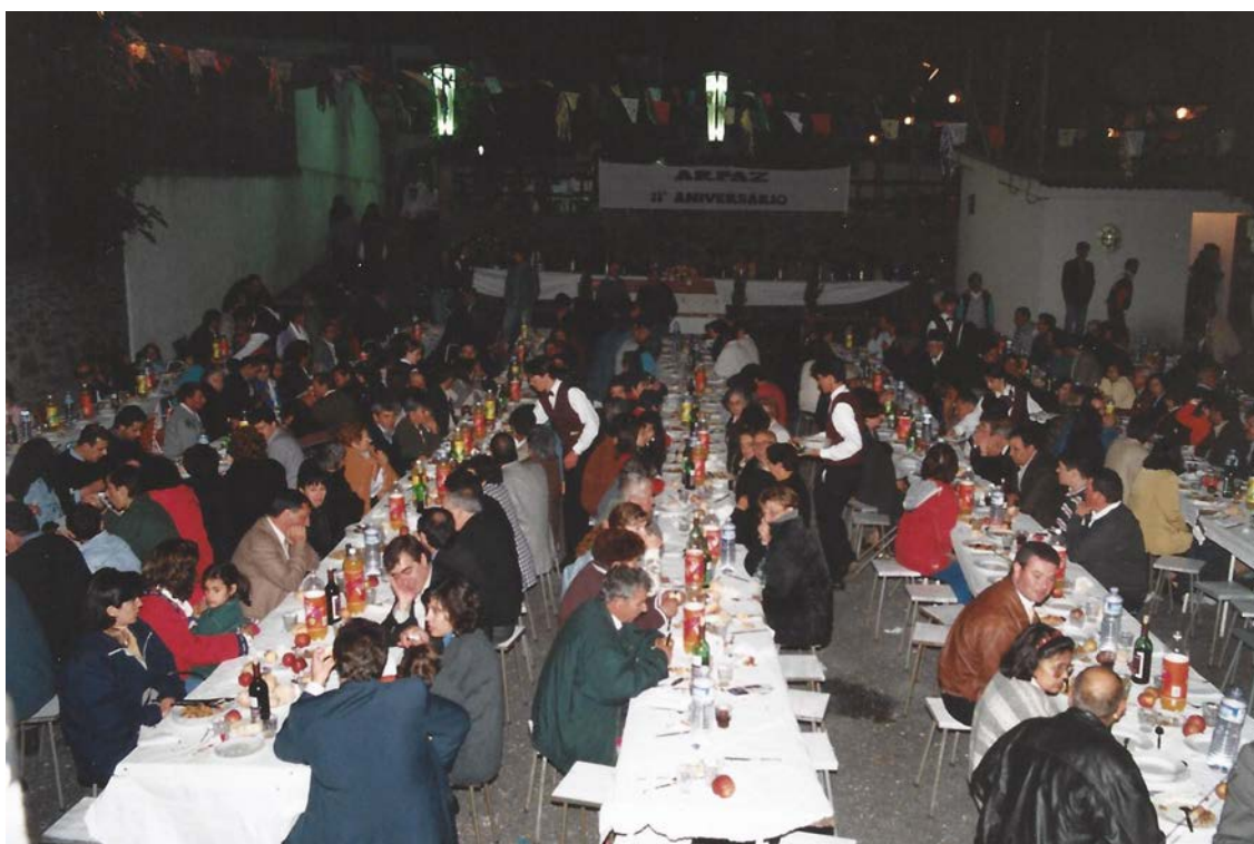
Jantar do 11º aniversário 1997