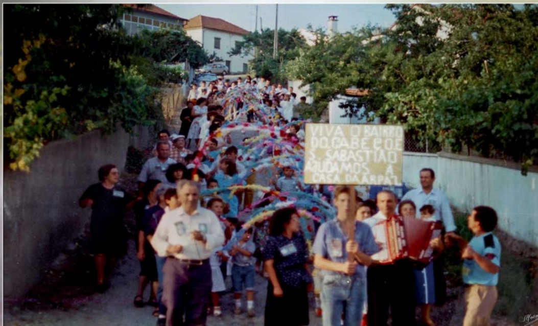
Cortejo de oferendas 1986

Associação Regional de Solidariedade e Progresso Alto Zêzere