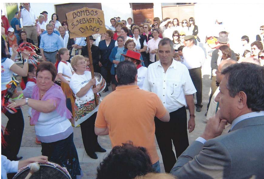
Inauguração lar s. simão 2008