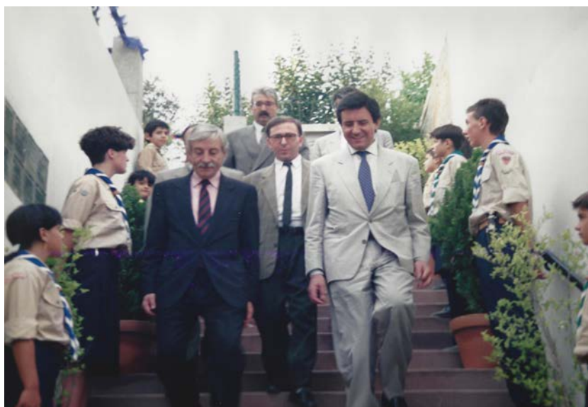
Visita Secretário Estado Vieira de Castro, 1991