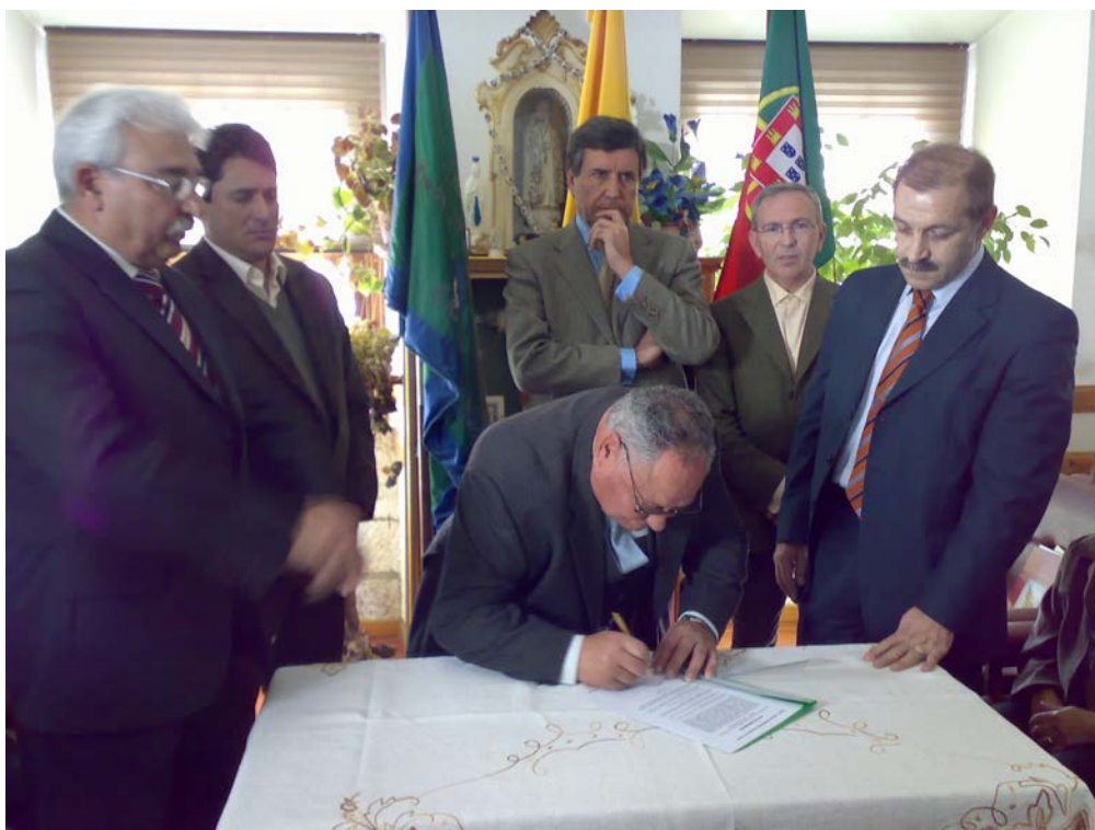
Assinatura empreitada do lar de s.simão 2007