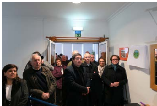
Benção da imagem de s.simão