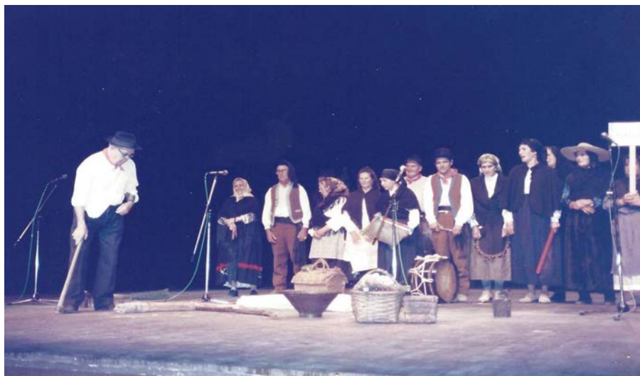
Festival Internacional 3ª Idade Macon, França, 1988

Associação Regional de Solidariedade e Progresso Alto Zêzere