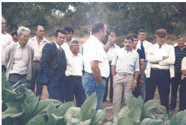
Visita Cova Beira, 1986