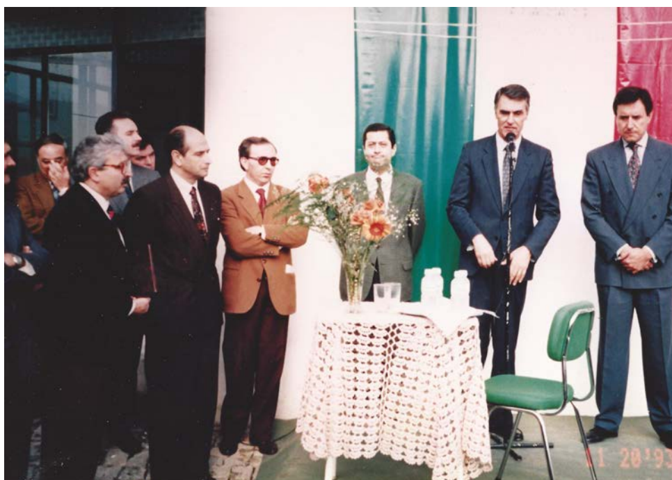
Visita Primeiro-Ministro Cavaco Silva, 1993

Associação Regional de Solidariedade e Progresso Alto Zêzere