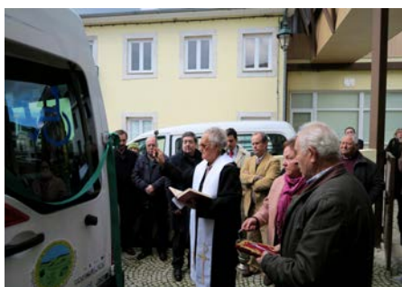
Inauguração ampliação lar. s.simão 2015