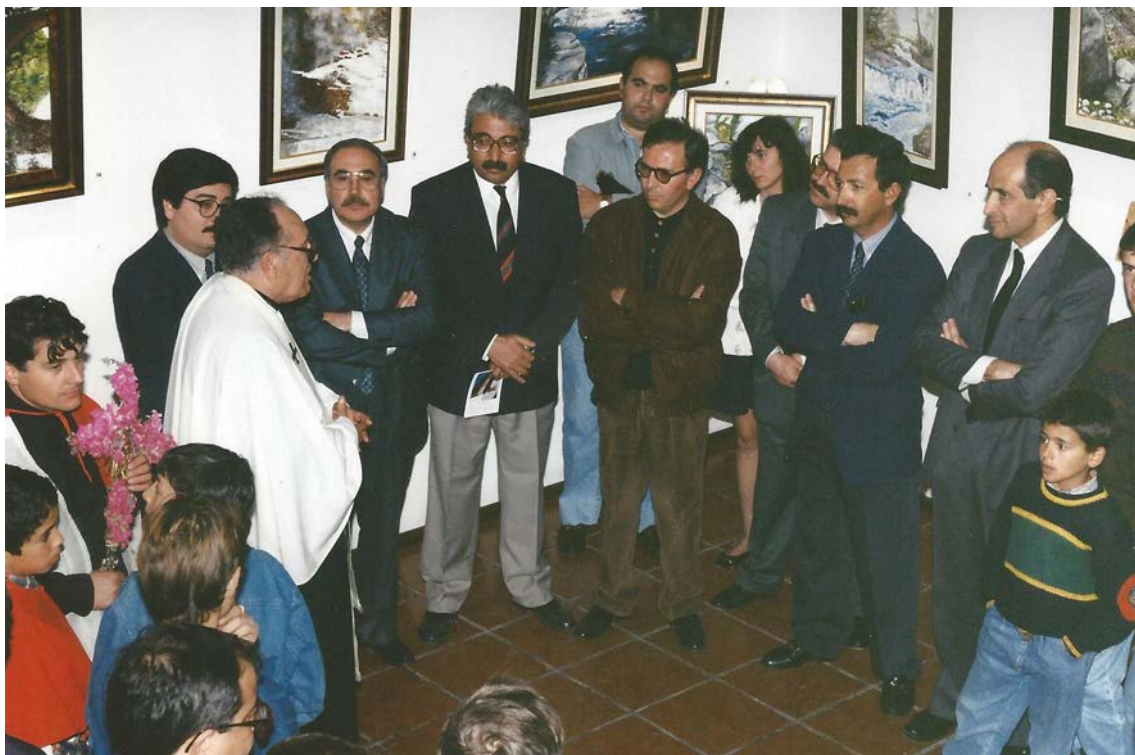
Inauguração Casa da Juventude, 1994

Associação Regional de Solidariedade e Progresso Alto Zêzere